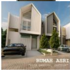
Unit Paksi Pecteur Hamore (tipikal housing 6x2)rd